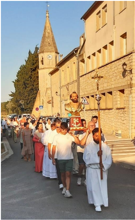
La procession jusqu'au calvaire.