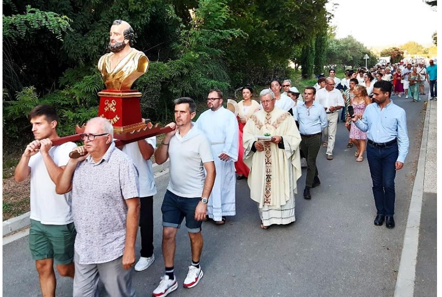
Prières devant la croix calvaire du village.